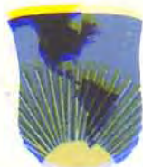
BANCO INTERAMERICANO DE DESARROLLO (IDB)