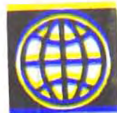
BANCO MUNDIAL Préstamo BIRF No. 3951-DO